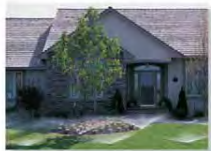
Die zuverlässige und stabile Pro-Spray® ist ideal für Hausgartenanlagen.

E ndlich! Hunter hat nun ein Sprühdüsengehäuse entwickelt, welches sämtlichen Anforderungen für eine einfache Installation und einen zuverlässigen Betrieb sicherstellt. Entwickelt für eine hohe Lebensdauer und rauen Einsatz, ist die neue Hunter Pro-Spray® mit der Präzision hergestellt worden, die erforderlich ist, um diese Höchstleistung sicherzustellen. Das Gehäuse besteht aus hochwertigem ABS, einschließlich eines verstärkten Grundkörpers und der Deckelverschraubung. Die Installation und Justierung wird durch exklusive Verstärkungsrippen vereinfacht. Diese geben dem Pro-Spray® zusätzliche Stabilität auch in leichteren Erdböden. Aber Stabilität ist nicht der einzige Vorteil dieses Sprüher. Die neue Pro-Spray® zeichnet sich auch durch die benutzerfreundliche Spülkappe und eine multifunktionelle Aufsteigerdichtung aus, die einen dauerhaft unkontrollierten Wasserverlust während des Ausfahrens eliminiert. Das Düsengehäuse ist kompatibel zu allen Innengewindedüsen der Industrie, sowie selbstverständlich zu allen Hunter Düsen. Ein Sprühregner entwickelt für die professionelle Anwendung.